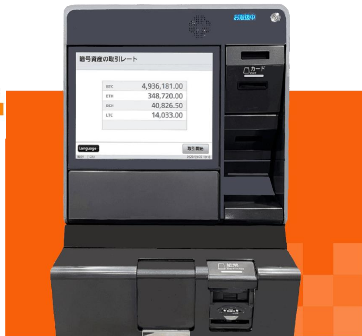
グローリー株式会社製の端末

※発明の名称：暗号資産両替システム、暗号資産両替方法および暗号資産両替プログラム